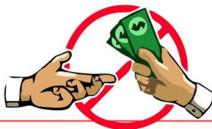
DIAGRAMA DE LA CORRUPCIÓN

Ejercicio efectivo de los derechos fundamentales de los ciudadanos