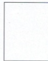
Huella Digital (*)

Declaro que la información proporcionada es veraz y, en caso necesario, autorizo su investigación.