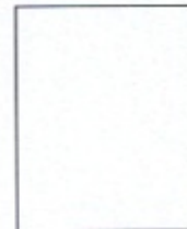
Huella Digital (*)

Declaro que la información proporcionada es veraz y, en caso necesario, autorizo su investigación.